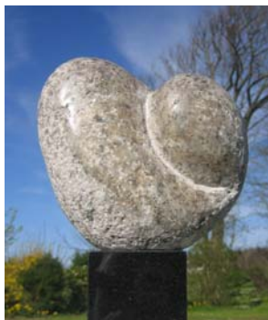
# 151, Tosomhed