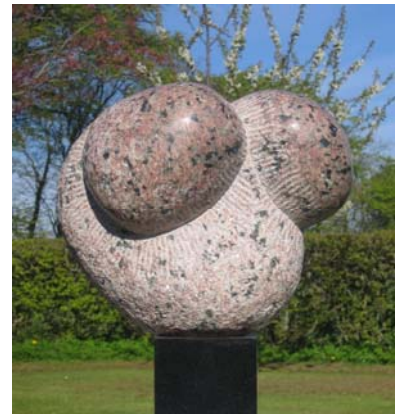
# 163, Somebody