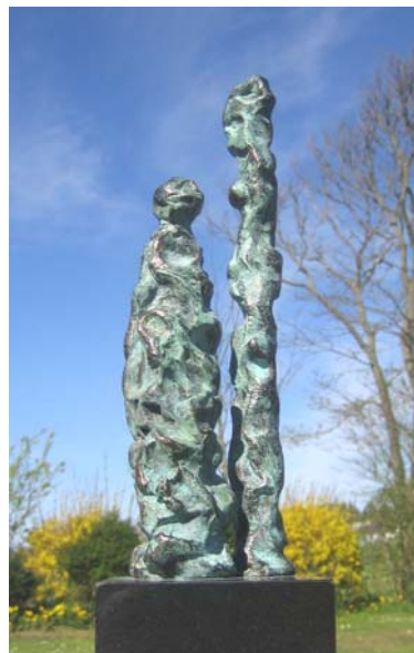
# 367, Happy days