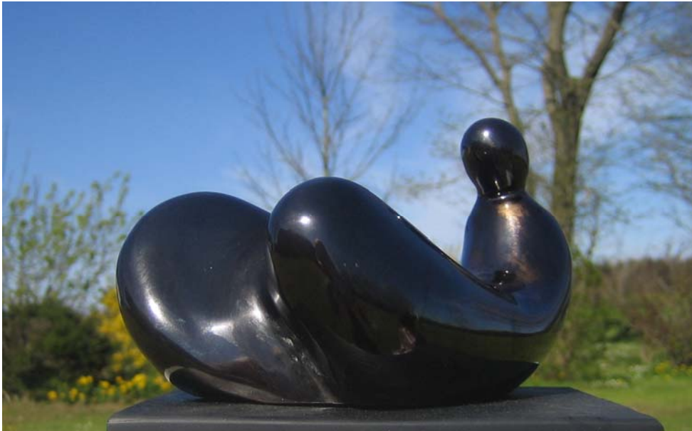
# 408 Waiting