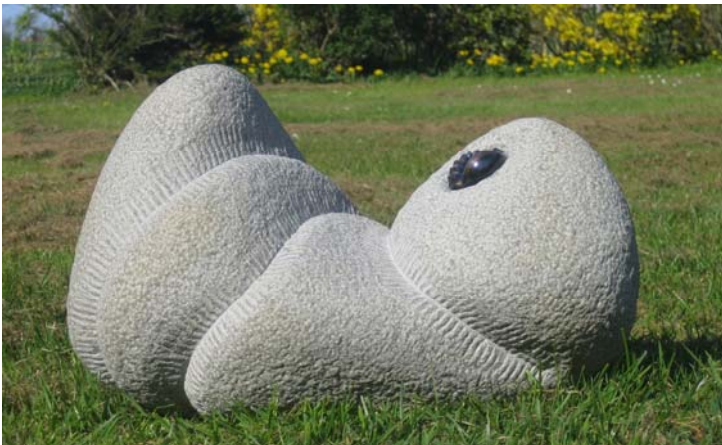
# 369, Salty Dog