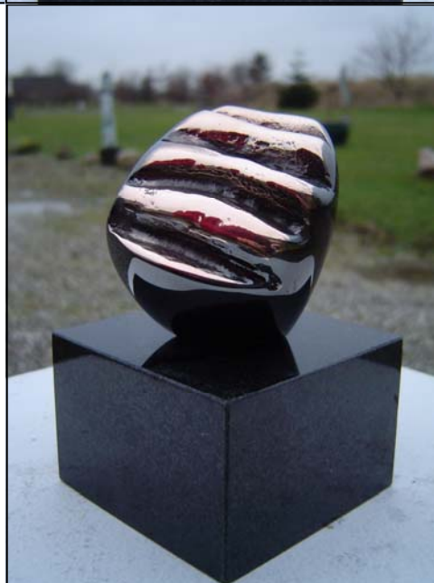
# 312, Grumling

Søndergade 41 E DK-8700 Horsens Tlf. 7625 1445 Fax 7625 1448 Info@gb-h.dk www.gb-h.dk