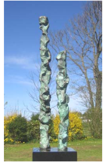
# 114, Mig og min lillebror