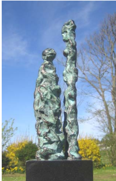
# 367, Happy days