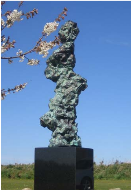
# 383, Presto