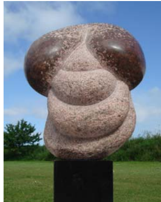
# 265, Nordfynsk Bondepige