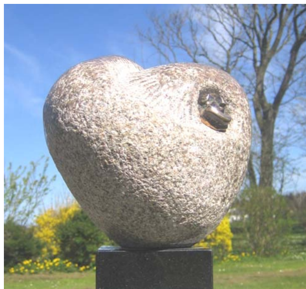
# 279, In Between