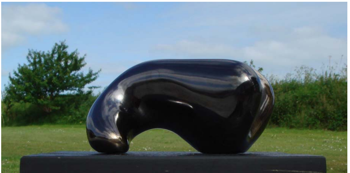
# 409 Forventning