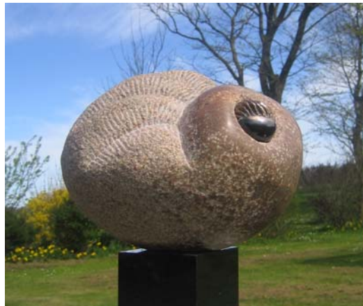
# 290, Stony