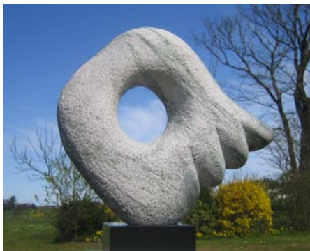
# 14, Trust the leader

Et spørgsmål rejser sig dog i forbindelse med Holms menneskefigurer. Kan en kunst med nok æstetiserende abstrakte, men trods alt antropomorfe former undgå, at et eksistentielt indhold sniger sig ind bag om ryggen på kunstneren, selv om han kun er ude på at dyrke det æstetiske og skabe en smuk ydre form? Vi har i vor tid skabt en praksis helt modsat grækernes. De skabte i arkaisk og højklassisk tid et utroligt smukt menneske, fordi de satsede på dette menneskes indre værd i en udvikling mod demokrati, så det Skønne, det Gode og det Sande bragtes sammen. Glæden, livslysten, men også tragedien var til stede,