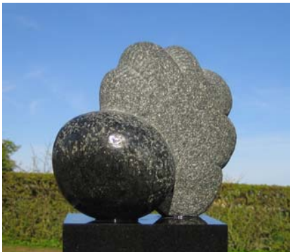
# 65 Hardy