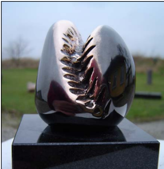
# 311, Grumling