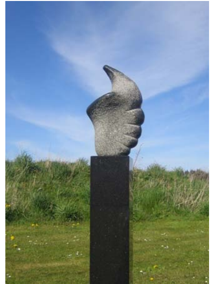
# 266, Primus Fantasia