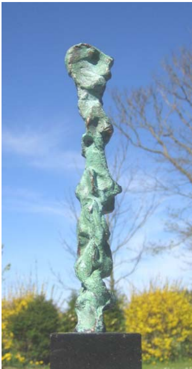
# 155, Billy